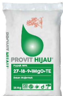
Jagonya pupuk daun